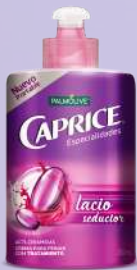
Crema para peinar Caprice