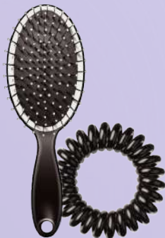
Cepillo + liga de cabello